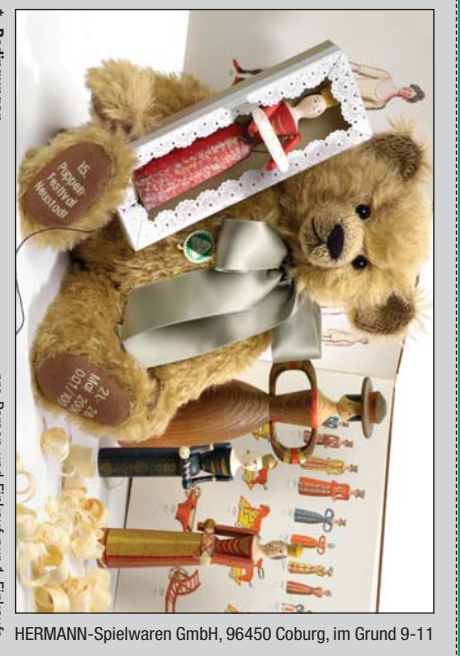
HERMANN-Spielwaren GmbH, 96450 Coburg, im Grund 9-11

Name, Vorname, Ort: _____ Dieser Gutschein wurde eingelöst von: _____ * Bedingungen - nur gültig in der Festivalwoche vom 22 bis 26. Mai 2006 - nur gültig für einen Einkaufswert ab EURO 100,- pro Kupon - Barauszahlung ist nicht möglich