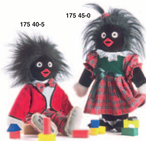
▲ Golly Boy Classic und Golly Girl Classic limitiert auf 500 Stück je Modell – weltweit

„Joy to the World“ – Musical Santa Bag mit Musik „Joy to the World“ mit einem HERMANN Miniatur Teddybär und einem Original Steinbach Miniatur Nußknacker limitiert auf 250 Stück weltweit