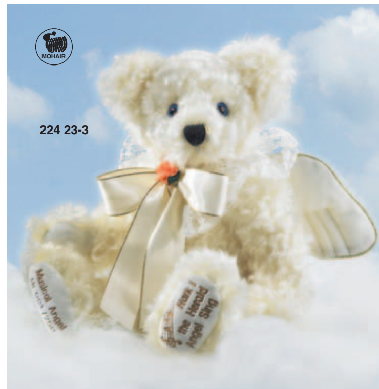
◀ Glorious Angel mit Musik „Stille Nacht“ European Edition – limitiert auf 250 Stück