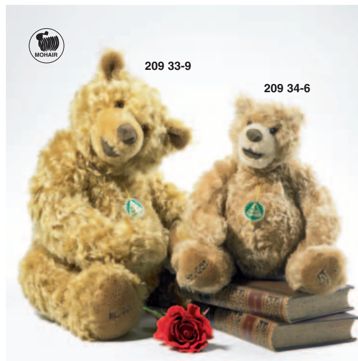
▲ Künstlerbären Design „Kristina Dietzel“ Groß-Oswin und Klein-Oswald limitiert auf 100 Stück je Modell – weltweit