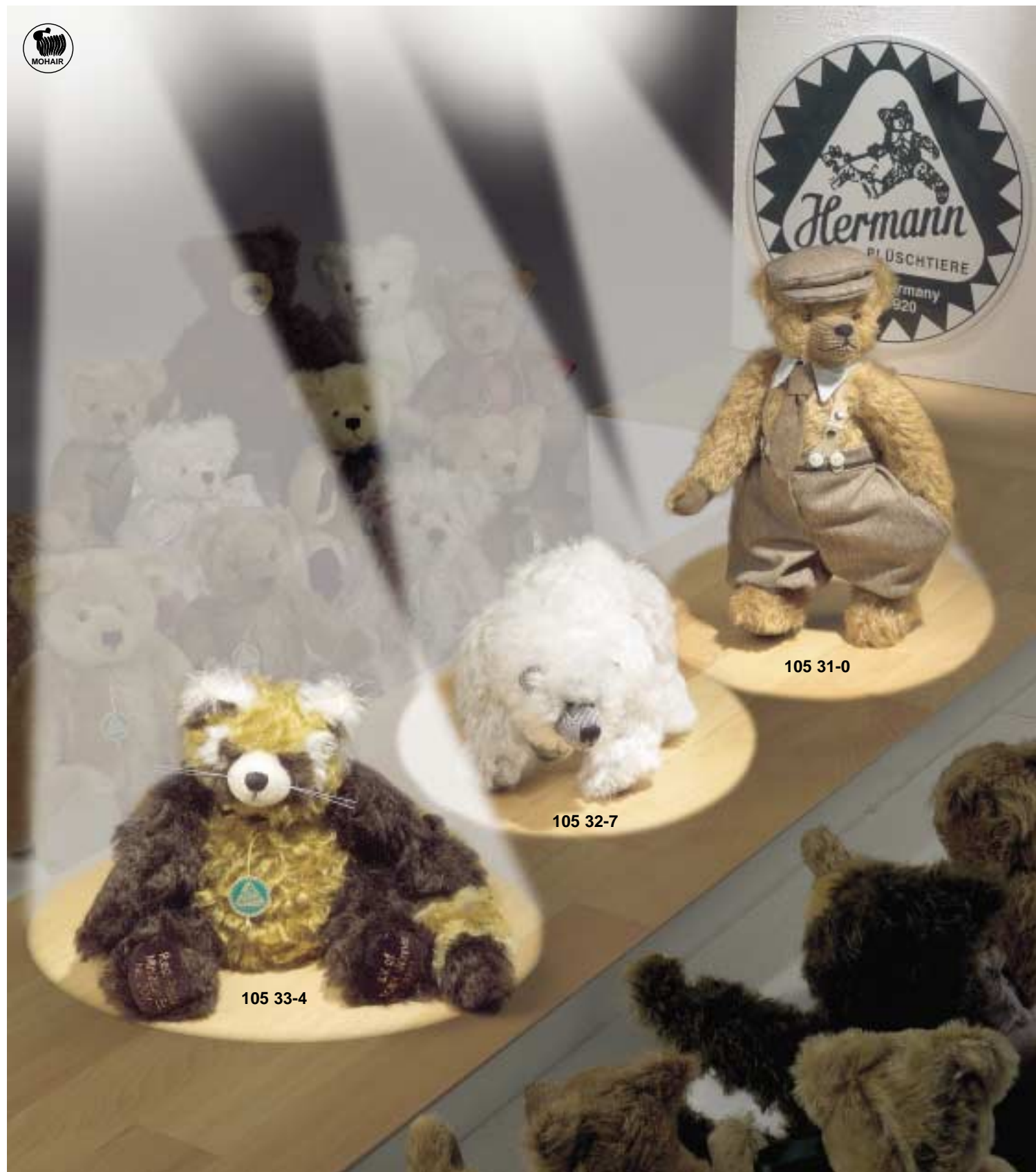
▲ Red Panda Miniatur Edition small Version of the TOBY™ Winner 2001 limitiert auf 1000 Stück weltweit