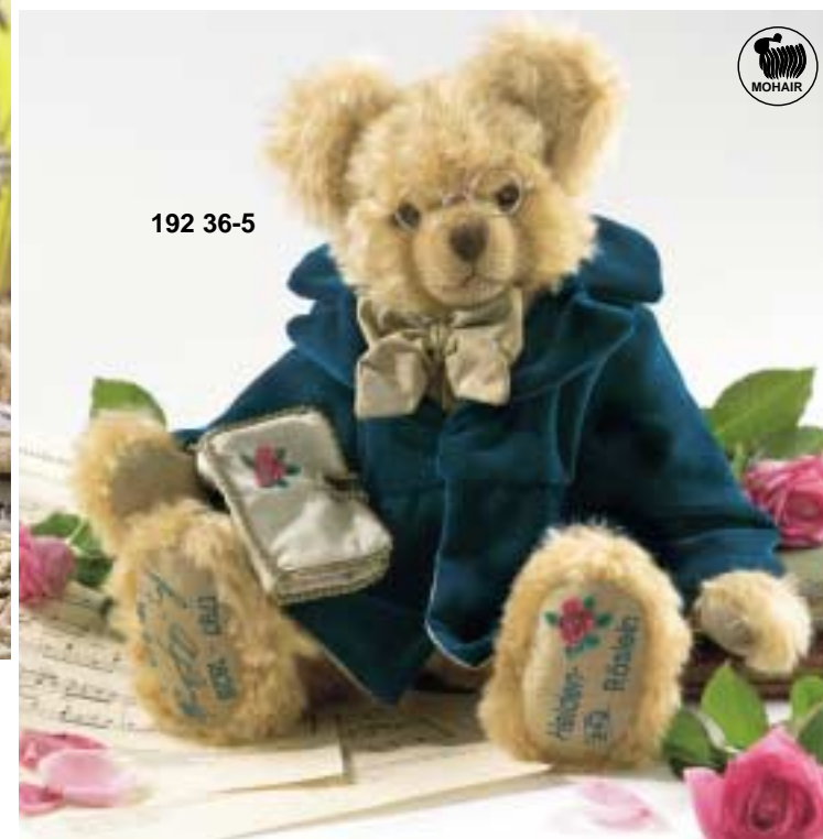
Franz Schubert mit Musik „Heidenröslein“ von Franz Schubert European Edition - limitiert auf 500 Stück