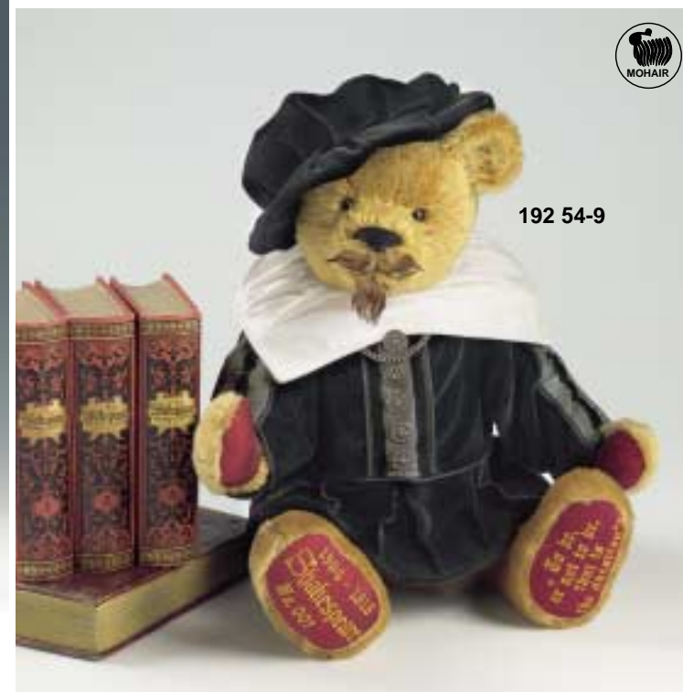
◀ Geisha nominiert für den TOBY™ Award 2002 limitiert auf 1000 Stück - weltweit ▼ William Shakespeare limitiert auf 1000 Stück - weltweit