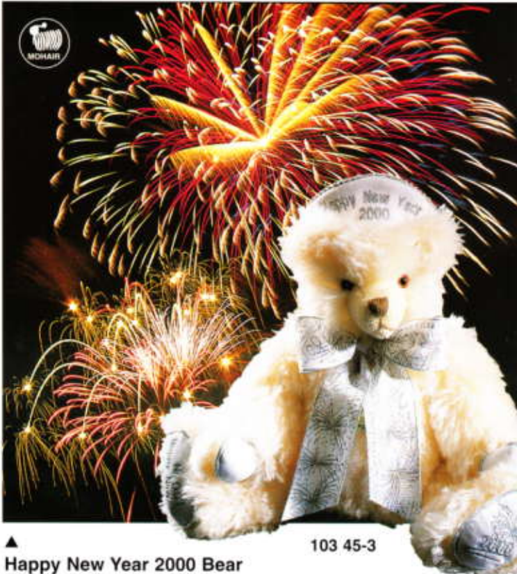
▲ Happy New Year 2000 Bear limitiert auf 2000 Stück - weltweit