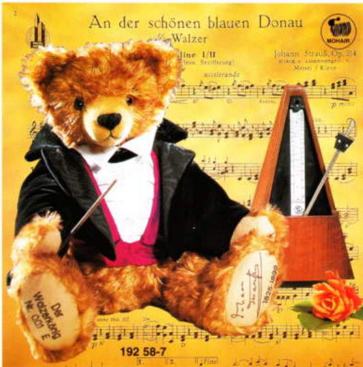
▲ Der Walzerkönig "Johann Strauß" zum 100. Todestag von Johann Strauß mit Musik "Donauwalzer" European Edition - limitiert auf 500 Stück