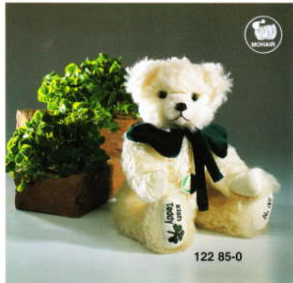
Irish-Teddy limitiert auf 1000 Stück weltweit