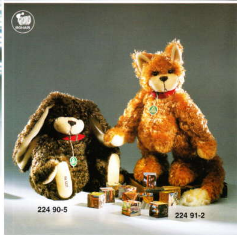
Künstlerbären "Biggi Netzel" ▲ "Stöpsel, François und Minka" limitiert auf 500 Stück je Modell - weltweit